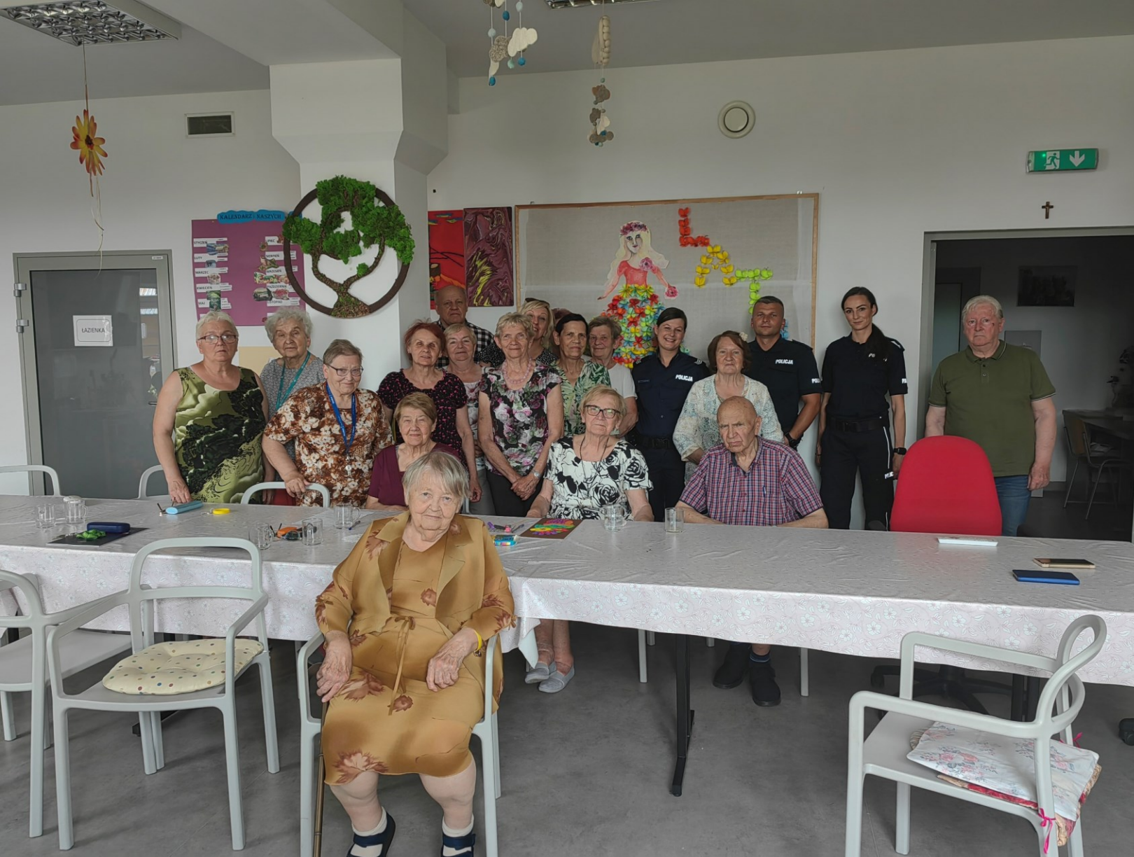
czerwiec 2023 r. trzecie spotkanie na temat bezpieczeństwa seniorów w Dzienny Domu Pobytu „Kotwica”.