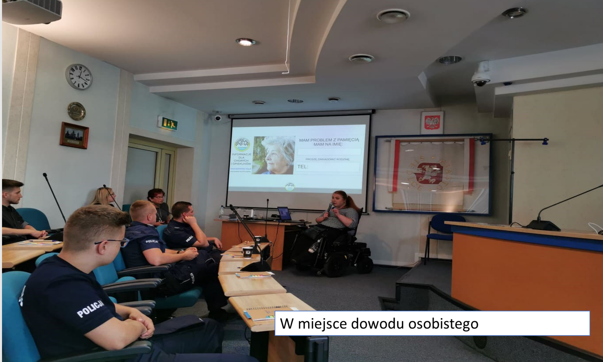
W miejsce dowodu osobistego